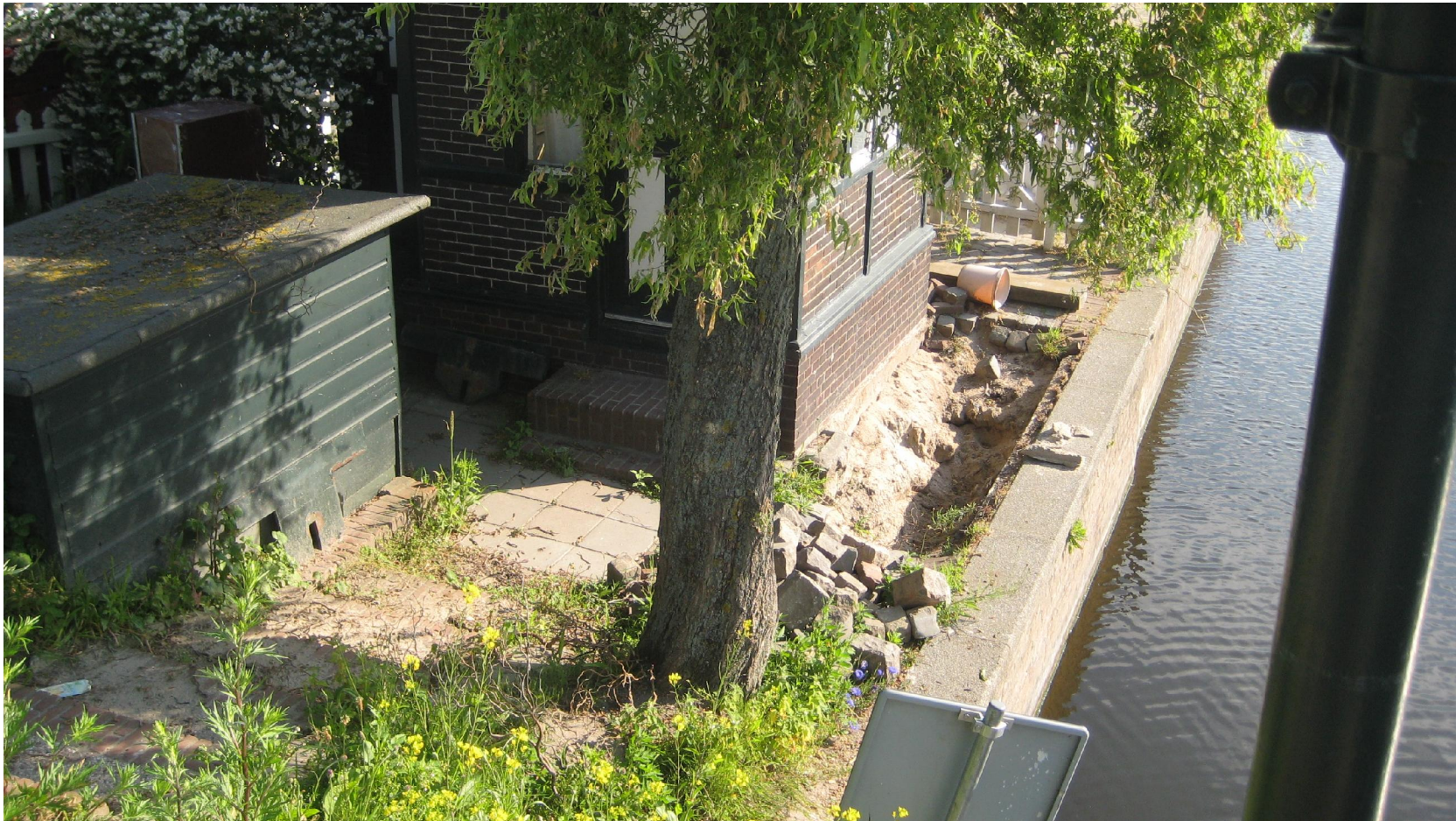
Onvoldoende restauratieonderhoud rond het Brugwachtershuisje